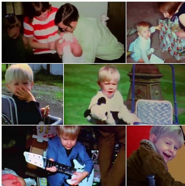
Figura 1. Imagens técnicas registram a infância de Kurt Cobain.