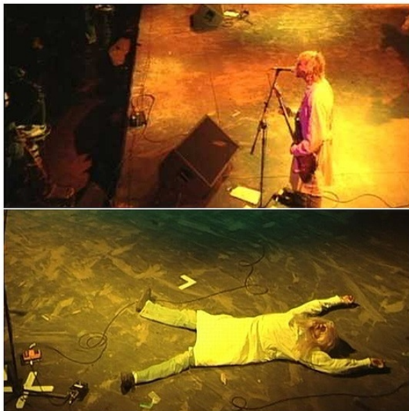
Figura 6. Kurt encena sua morte durante show no megafestival inglês Reading em 1992.

Reproduções: Cobain Montage of Heck (2015).