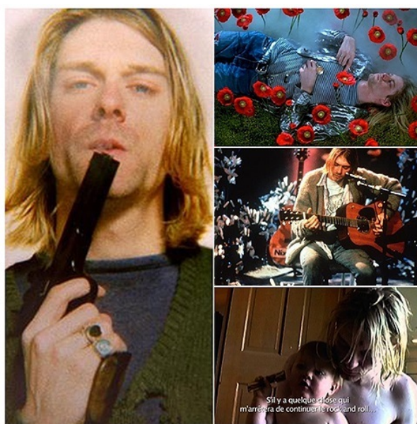
Figura 7. Kurt empunha uma arma de fogo em seu último ensaio fotográfico, assinado por Yuri Lenquette e realizado em Paris dois meses antes do seu suicídio em abril de 1994, em Seattle. Acima, cena lúgubre do clipe da música Heart Shaped Box , do disco In Útero (1993). Ao centro, clima de velório no Unplugged MTV (1993). Abaixo, prejudicado pela heroína enquanto Frances ainda era bebê.

E segue em outros escritos: “Enterrado fundo em um sonho de heroína [...] eu fiquei tão chapado que arranhei até sangrar” (01:45:38). Ou ainda: “Não me importo se eu murcho sozinho, eu não me preocupo se eu não tenho uma mente” 34 (01:45:52).