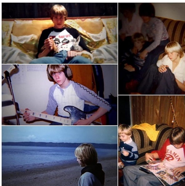
Figura 2. Durante a adolescência, Kurt Cobain torna-se mais introspectivo ao mesmo tempo em passa a tocar guitarra.

Em uma comunidade que reforça histórias sexuais de macho man como o ponto alto de todas as conversas, eu era um menino imaturo, mal desenvolvido, que nunca havia transado e que estava sempre a fim. Pobre garoto! Isso me incomodava, pois eu estava com tesão e sempre tinha que inventar histórias como “ah, quando tirei férias conheci uma menina, transamos e ela amou etc, etc”. ( Cobain: Montage of Heck , 2015: 18:45-19:18).