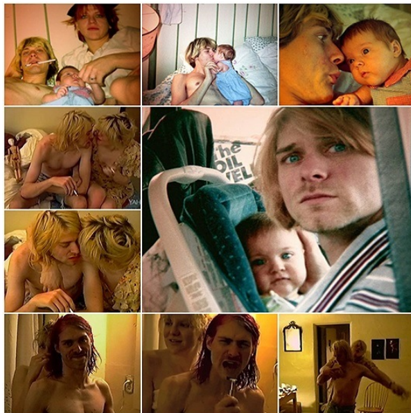
Figura 5. Kurt Cobain com a mulher, Courtney Love, e com a filha, Frances Bean, em sua casa. Reproduções: Cobain Montage of Heck (2015).

no mundo sensível à morada, palácio, templo e claustro, por exemplo, ou então mais ambivalentes, dotadas de sentidos ambíguos e complementares como cave, concavidade, ventre materno, penetração, enterramento, gruta, sepulcro, túmulo, retorno, descanso. Durand (2012: 241) retoma dados sobre simbolismo arcaico oferecidos por Eliade para mostrar como muitas destas imagens constelam para propor sentidos sobre vida e morte – sendo vida uma espécie de separação natural da terra para a vivência no mundo, e morte um retorno à casa para sepultamento na terra natal.